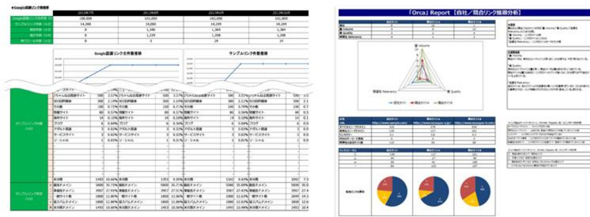
<レポートイメージ図>

今回自社サイトのリンク分析だけでなく、競合サイトのリンク分析も可能となるアップデートを行いました。競合サイトがどのようなサイトからリンクを貼られているかを分析するなど、自社サイトと競合サイトのリンク構成を可視化することで多角的な比較が可能と