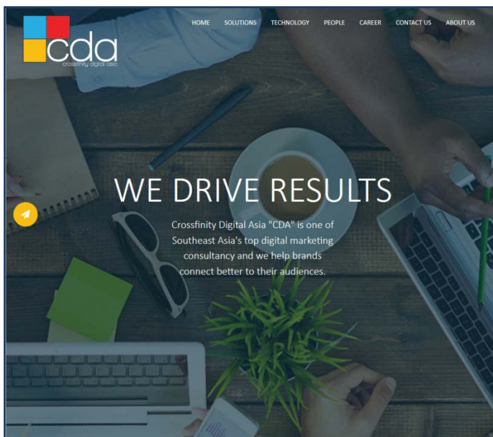
PC 向け トップ画面